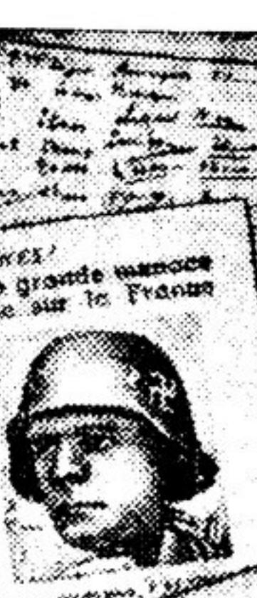
На снимке — первая страница листовки с текстом обращения французской и немецкой молодежи к молодежи из других стран с призывом действовать совместно против боннского и парижского военных договоров и франко-американского пакта.

«Атлантические» холодеяники. Несомненно Италия обнаруживает истинно физическая нехватка вагонов-холодеяников для перевозки скоропортящихся продуктов. Овощи, фрукты, рыба гниют на складах — их нечем вывезти. Италия не дает итальянские холодеяники? Оказывается, они... «атлантически» итальянский журнал «Вие нуово» сообщает, что значительное количество вагонов-холодеяников передано командованием американских войск в Лериано, где находится военная база США. В этих вагонах перевозятся продовольствие для войск США, расквартированных в европейских странах.