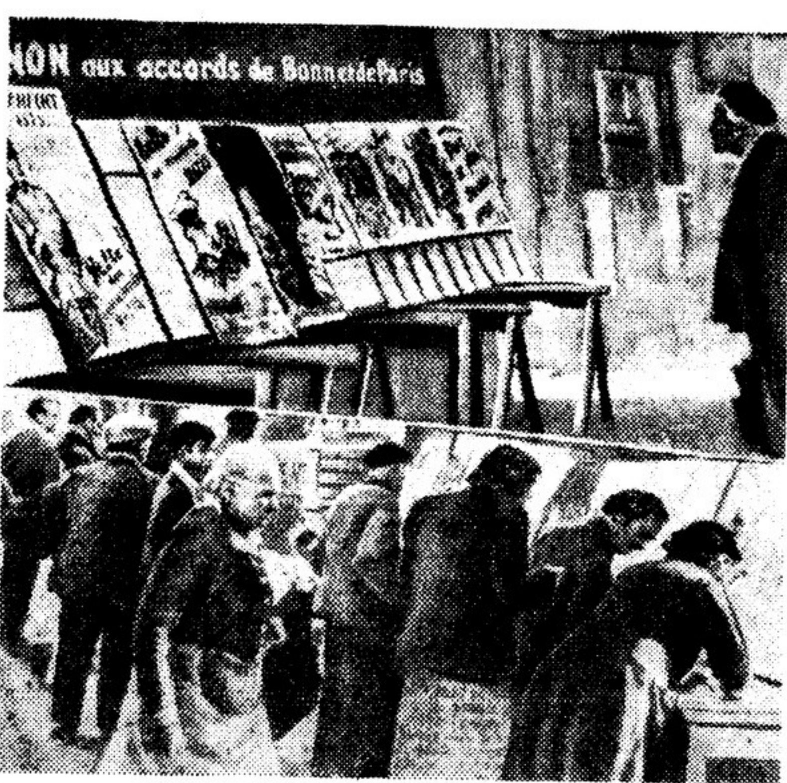
На рыночной площади в Витри установлены изображения на фото щиты с плакатами, напоминающими о пережитой французами трагедии гитлеровской оккупации. «Долой боннский и парижский договоры!» — гласит надпись над щитами. Прохожие рассматривают плакаты и подписывают петиции протеста против боннского и парижского договоров.

Доминика ДЕЗАНТИ. ПАРИЖ, 12 ноября. (По телеграфу).